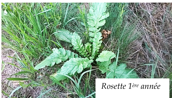
Rosette 1 ère année