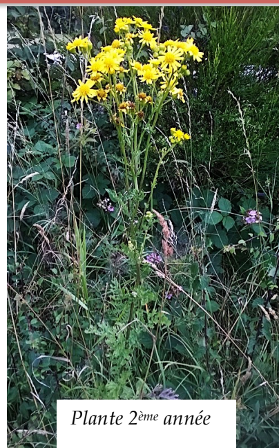
Plante 2 ème année

Toutes les espèces de séneçons sont toxiques mais le séneçon de Jacob est le plus problématique vu sa diffusion actuelle.