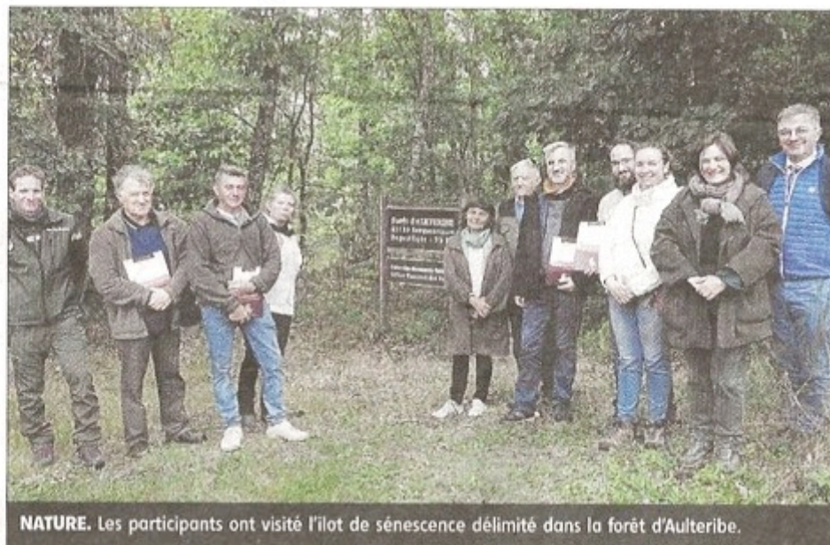
NATURE. Les participants ont visité l'îlot de sénescence délimité dans la forêt d'Aulteribe.

Un îlot de sénescence est une petite zone (de 0,5 à quelques hectares), déli-